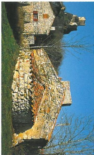
Larochette : en passant près du four banal, on remarque les vestiges perchés du château présenté p. 16.