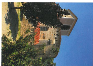
Église romane de Beaumont.

Une balade en terre crétacière, inondée de sa place, où l'arbre n'a pas aux douces ondulations où se sont posés des villages au charme discret ; enfin une piste d'envol pour découvrir le pays d'en haut.